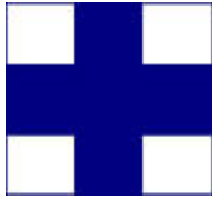
X旗：個別リコール艇あり