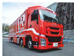
（実際のVR防災体験車）

※ 13歳未満の方は、子供用の ヘッドマウントディスプレイを 着用して体験します。